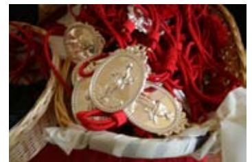
I medaglioni antoniani

Notiziario mensile dell'Arciconfraternita di Sant'Antonio di Padova