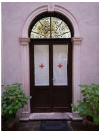
Scoletta del Santo - ingresso della Cancelleria

Quindi è seguita l'omelia nella quale P. Poiana ha fondato l'impegno laicale nella Confraternita sulle Sacre scritture e gli insegnamenti della Chiesa. Invocato lo Spirito Santo con il canto, Rettore, Cappellano e Priore si sono allora spostati di fronte ai medaglioni antoniani che sono stati benedetti con la formula tradizionale: Padre Santo, la Tua mano benedica † queste medaglie che portiamo in ricordo di Antonio di Padova, Tuo servo buono e fedele. La Sua immagine, posta sul nostro petto, ci difenda dal male e ci aiuti ad imitarlo nella fedeltà al Vangelo e nella prontezza alla carità. Assisti questi tuoi figli che per la prima volta la indossano come segno di appartenenza all'Arciconfraternita del Santo. Concedi loro per intercessione della Vergine Santa, di Sant'Antonio e di San Francesco, di perseverare nel bene e di giungere alla Gloria della Patria Celeste, nella comunione dei Santi. Per Cristo Nostro Signore.