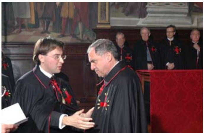
Il Priore impone la medaglia antoniana ad un Confratello