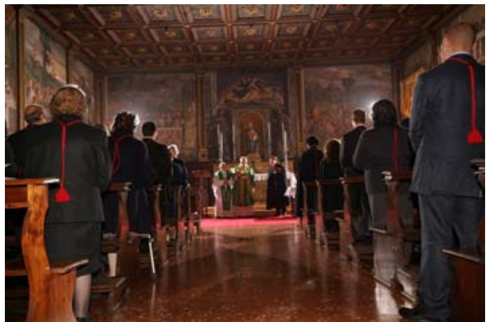
Una visione d'insieme della Sala Priorale

Glorioso S. Antonio, scrigno delle Sacre Scritture, Tu che hai conformato la vita alla lode della Trinità, ascolta la nostra supplica ed esaudisci i nostri desideri. Ci rivolgiamo a Te, certi di trovare ascolto; a Te che immergendo il cuore nella Sacra Scrittura l'hai studiata, assimilata, vissuta e fatta tuo respiro, sospiro, parola: fa che anche noi possiamo con il Tuo aiuto capirne l'importanza, percepirne l'assolutezza, assaporarne la bellezza, gustarne la profondità. Fa che possiamo gustare il Vangelo di Gesù Cristo, che Tu hai tanto amato; fa che possiamo vivere nella nostra vita di quel mistero che Tu hai tanto celebrato; fa che possiamo annunciare a tutti la lieta novella, che Tu hai proclamato alle persone e agli animali. Rendi forti i nostri passi, coraggiose le strade, decise le scelte, prudenti le prove.