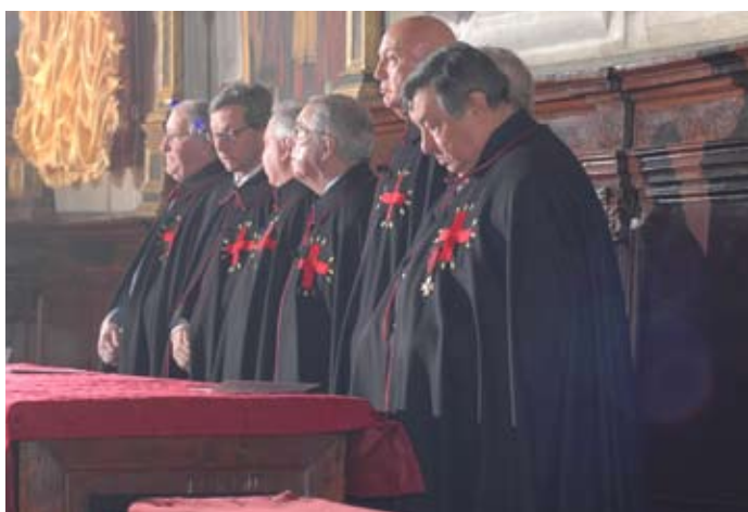
Alcuni membri del Consiglio Direttivo sul bancone degli Officiali.