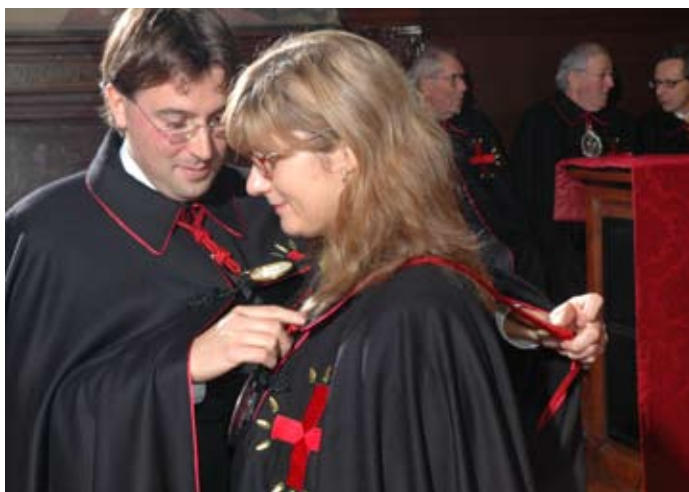
Il Priore impone la medaglia antoniana ad una Consorella.