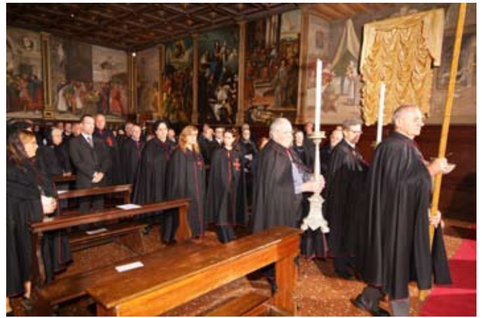
La processione d'ingresso

Prima della benedizione e del canto antoniano conclusivo O dei Miracoli il Priore ha rivolto a tutti i presenti una propria esortazione, seguita dalla Supplica a Sant'Antonio, che qui riportiamo, così che ciascuno possa pregarla nella propria casa: