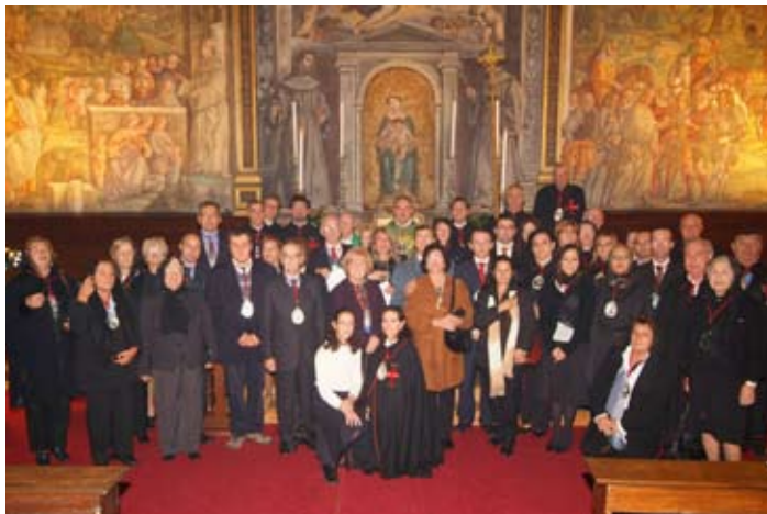
Tutti i partecipanti alla Cerimonia

3. Volete dedicare tempo e cuore ai fratelli bisognosi, cercando di servire il prossimo come fece il Santo?